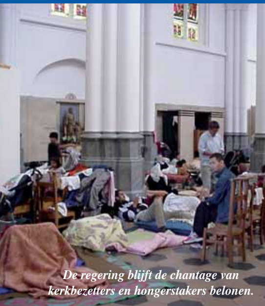
De regering blijft de chantage van kerkbezitters en hongerstakers belonen.

Minister van Binnenlandse Zaken Dewael (Open VLD) verklaarde onlangs dat hij op drie jaar tijd maar liefst 30.000 illegale vreemdelingen heeft geregulariseerd. Dat is ongeveer evenveel als de totale bevolking van Dewaels eigen stad Tongeren. De SPA en Groen