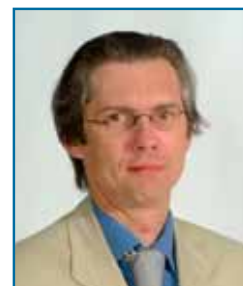
Erik Tack Vlaams volksvertegenwoordiger

Wie een voorheen nooit bewoond huis of appartement met bijhorende grond aankocht betaalde tot nu toe 21% BTW op het gebouw en 10% registratierechten op de grond, die in Vlaanderen tot maximum 12.500 euro meeneembaar zijn. Recent heeft de federale regering beslist in de toekomst 21% BTW te willen heffen op het geheel, dus ook op de grond. Op die manier zal de grond van een dergelijke woonst 10% of gemiddeld 10.000 euro meer kosten. Deze beslissing is ingegeven door de Waalse ministers onder druk van een aantal Waalse bedrijven, die hierdoor de BTW voor de gronden die ze willen saneren integraal kunnen recupereren. In Vlaanderen speelt dat veel minder want de bodemsanering is in Vlaanderen al veel verder gevorderd. De dupe van het verhaal is de jonge Vlaming die daardoor gemiddeld 10.000 euro meer zal moeten neertellen voor een nieuwbouwwoning.