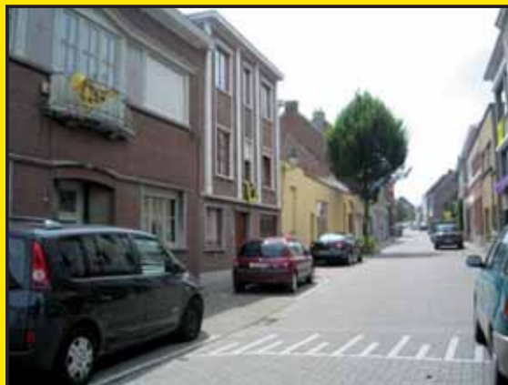
Christel De Bruecker Gemeenteraadslid

De leeuwenvlaggen werden gratis aangeboden met de vraag om deze uit te hangen op onze Vlaamse feestdag. Deze actie werd op een positieve manier onthaald bij de Denderleeuwse bevolking. Het was een oproep tot meer durf, meer zelfbewustzijn en meer vrijheid. Kortom, voor meer Vlaanderen.